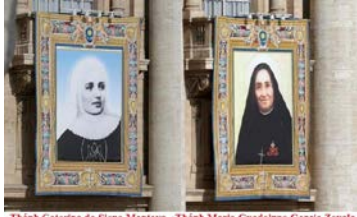
Thánh Caterina da Siena Montoya - Thánh Maria Guadalupe Garcia Zavala

Ngày Chúa nhật 12-05, Đức Thánh Cha Phanxicô đã cử hành Thánh lễ tại quảng trường Thánh Phêrô và cử hành nghi thức tuyên thánh lần đầu tiên.