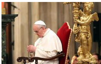
Đức Thánh Cha lần hạt tại Nhà Thờ Đức Bà Cả, Rôma

ROME, 13.5.2013 (Le Monde vu de Rome) – Giáo triều của Đức