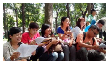
Thái Bình Dương TPP.

Một Thượng nghị sĩ Mỹ tuyên bố sẽ nhấn mạnh đến việc bảo đảm nhân quyền tại các nước như Việt Nam và Malaysia trong tiến trình các nước thương lượng về Hiệp định Mậu dịch Tự do Xuyên